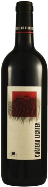
Château Lichten Rouge AC Domaines Rouvinez