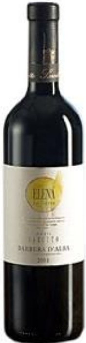
Barbera d'Alba Superiore DOC "Elena" Roberto Sarotto