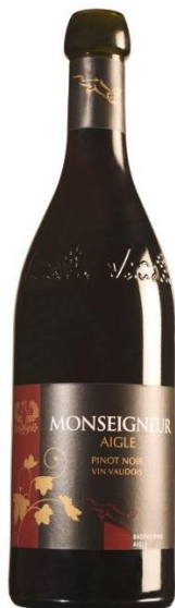
Aigle Pourpre „Monseigneur“ Chablais AOC Henri Badoux